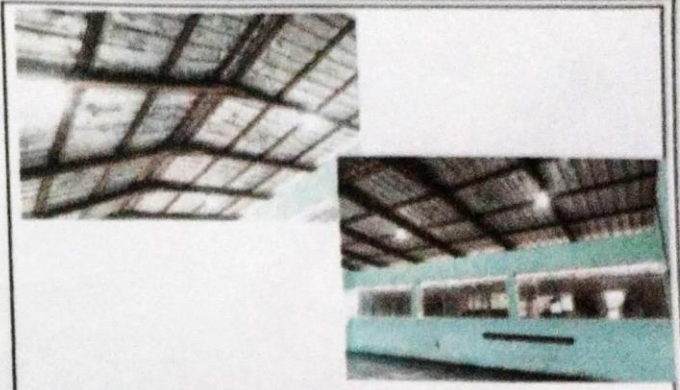
Foto 2: nueva instalacion electrica en las aulas de la escolita ya funcionando