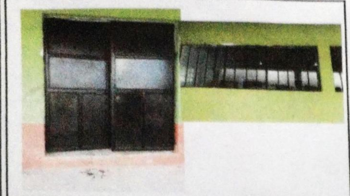
Foto 1: instalación de las puertas remozadas y pintadas, Estructura metalica de las ventanas y didrios colocados