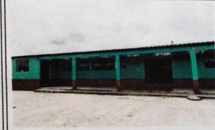
Foto 3: Proyecto terminado puertas, ventanas e instalacion electrica